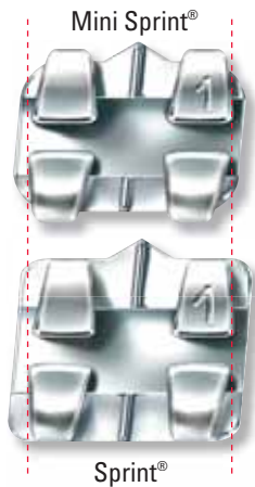
Abb. rechts: Die neuen Mini Sprint® Brackets bieten die selbe Rotationskontrolle wie Sprint® Brackets.

The Sprint® and Mini-Sprint® bracket are one piece brackets made of stainless steel using MIM technique (Metal Injection Moulding). They are nickel free and highly polished for perfect appearance. Mini Sprint® brackets are aesthetically more pleasing than standard Sprint® brackets. They are available for the area of high aesthetic value meaning from 5 to 5 for both the upper and lower arch. They provide an ideal mesial-distal dimension for uncompromised rotational control.